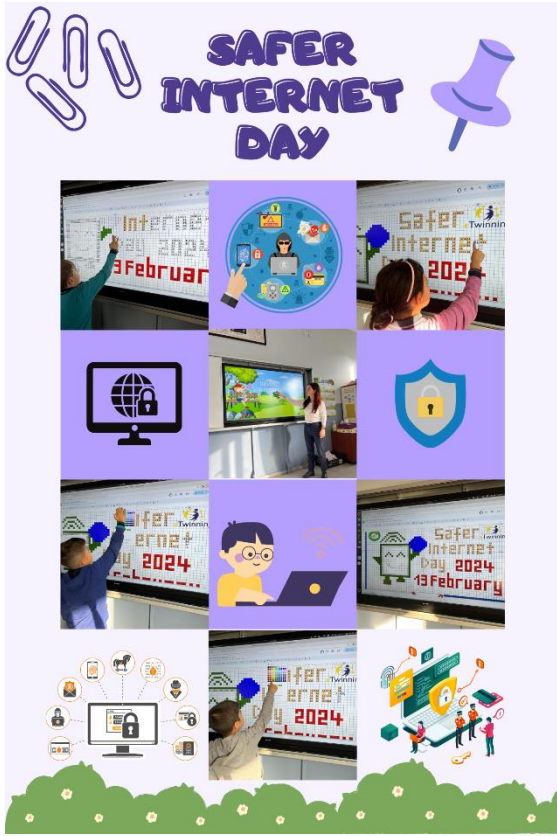
Proje Ortakları ile Yapılan Güvenli İnternet Günü / Pixel Kodlama