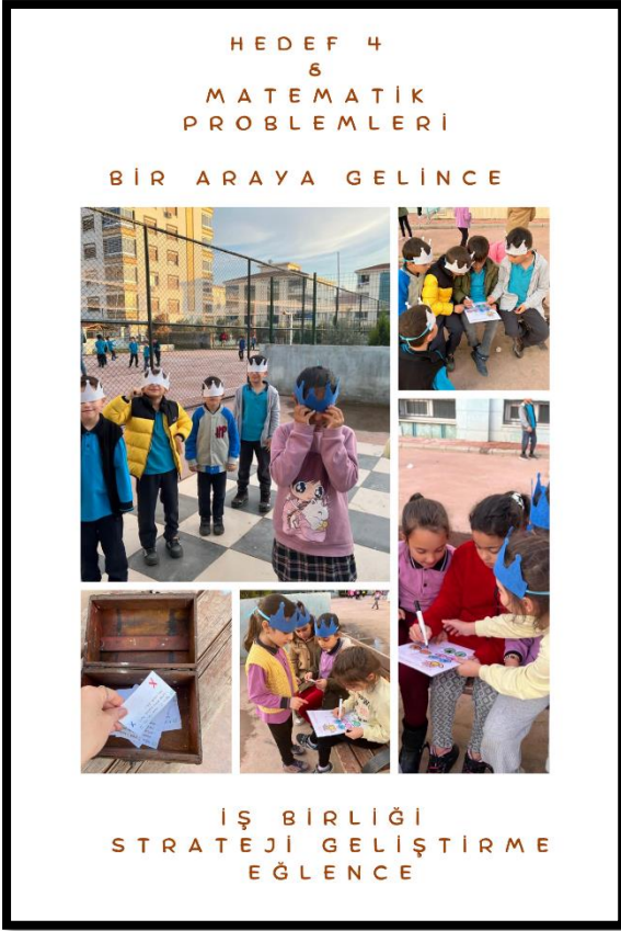
Zeka Oyunları (Hedef 4) / Matematik Problemleri ve Beden Eğitimi