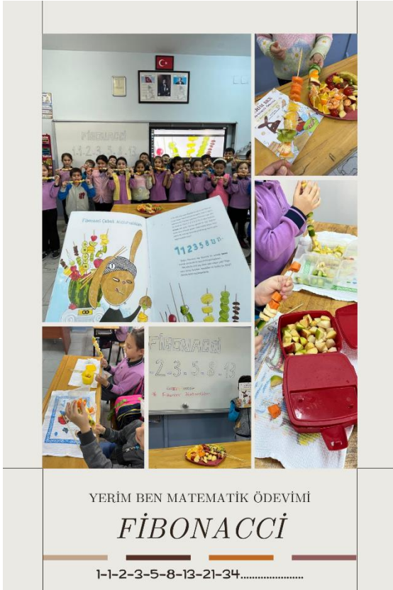
Fibonacci Sayılarını Tanıyorum