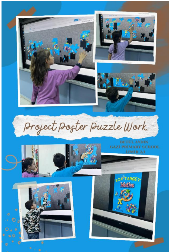
Web 2.0 Aracı Jigsawplanet / Proje Poster Yap Boz Çalışması