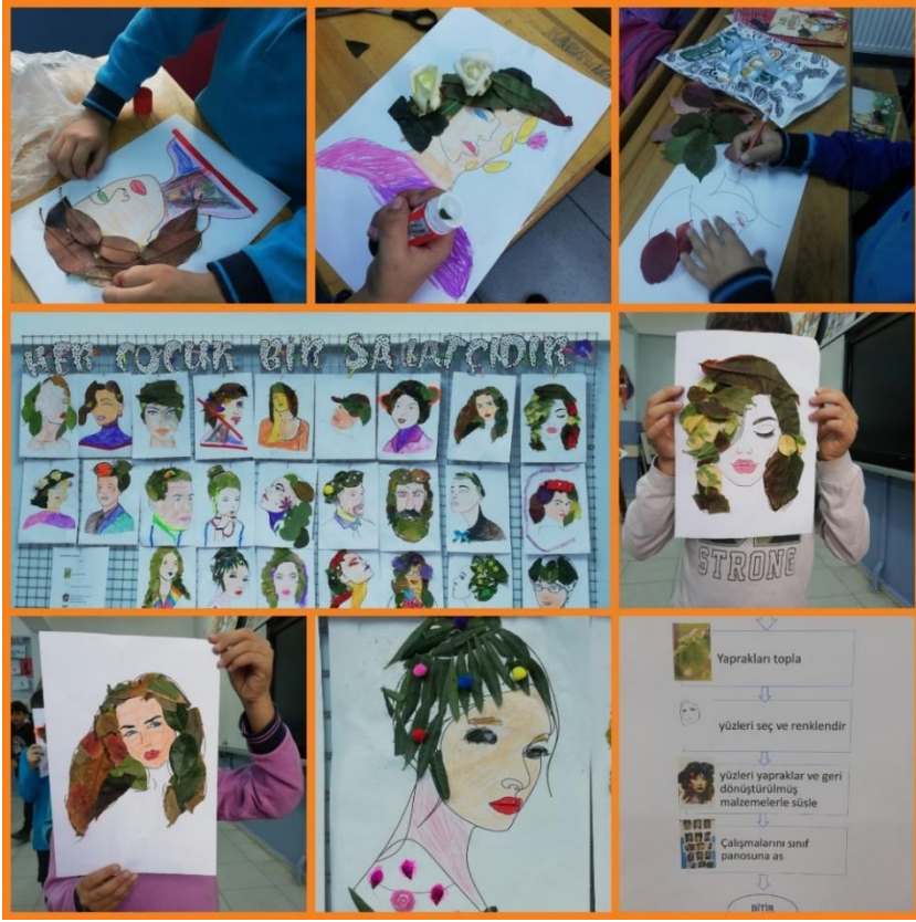
Algoritma çalışması. Matematik ve Sanat