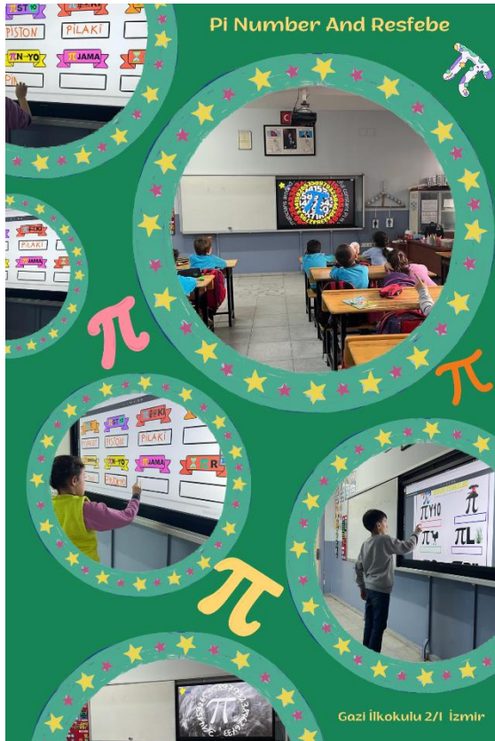
Pi Sayısı ve Resfebe Çalışması