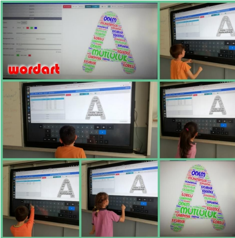
WordArt Web 2.0 Aracı Kelime Bulutu çalışması