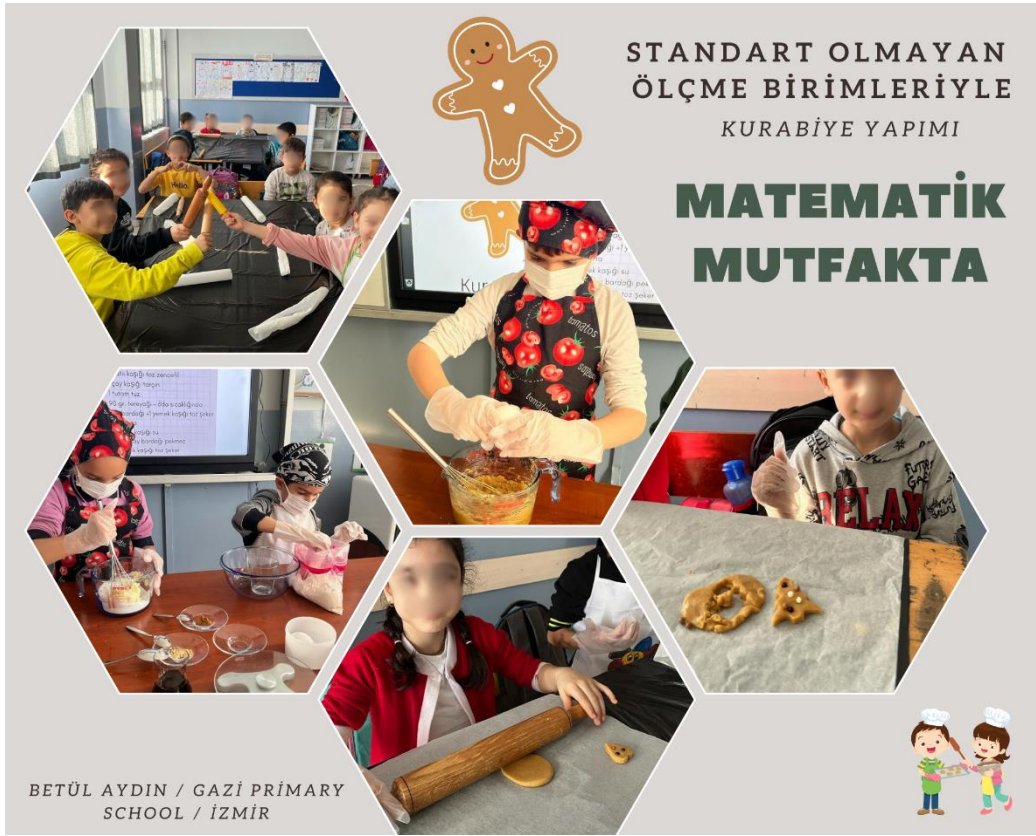
Standart Olmayan Ölçü Birimleriyle Sınıfta Kurabiye Yapımı